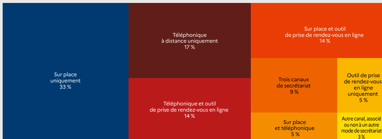
Schéma 2 Canaux de secrétariat utilisés par les médecins généralistes en 2022

Lecture > 33 % des médecins généralistes ayant un secrétariat en 2022 ont un secrétariat physique uniquement. 14 % ont à la fois un secrétariat sur place et un outil de prise de rendez-vous en ligne.