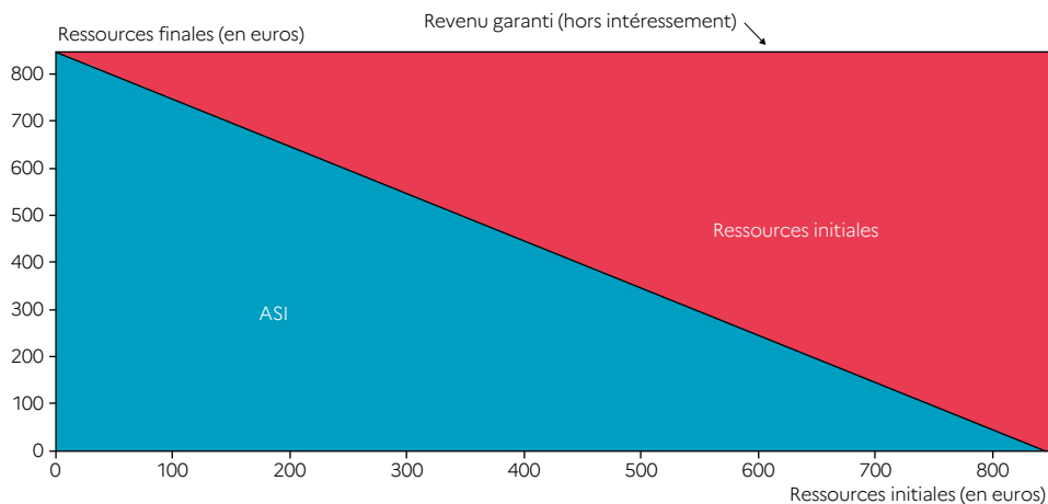
Schéma 1 Revenu mensuel garanti, hors intéressement, pour une personne seule selon ses ressources, au 1 er juillet 2022

Note > Le montant minimal d'une pension d'invalidité étant de 309,09 euros par mois au 1 er juillet 2022, le montant de l'ASI ne peut être supérieur à 537,88 euros pour une personne bénéficiant d'une pension d'invalidité.