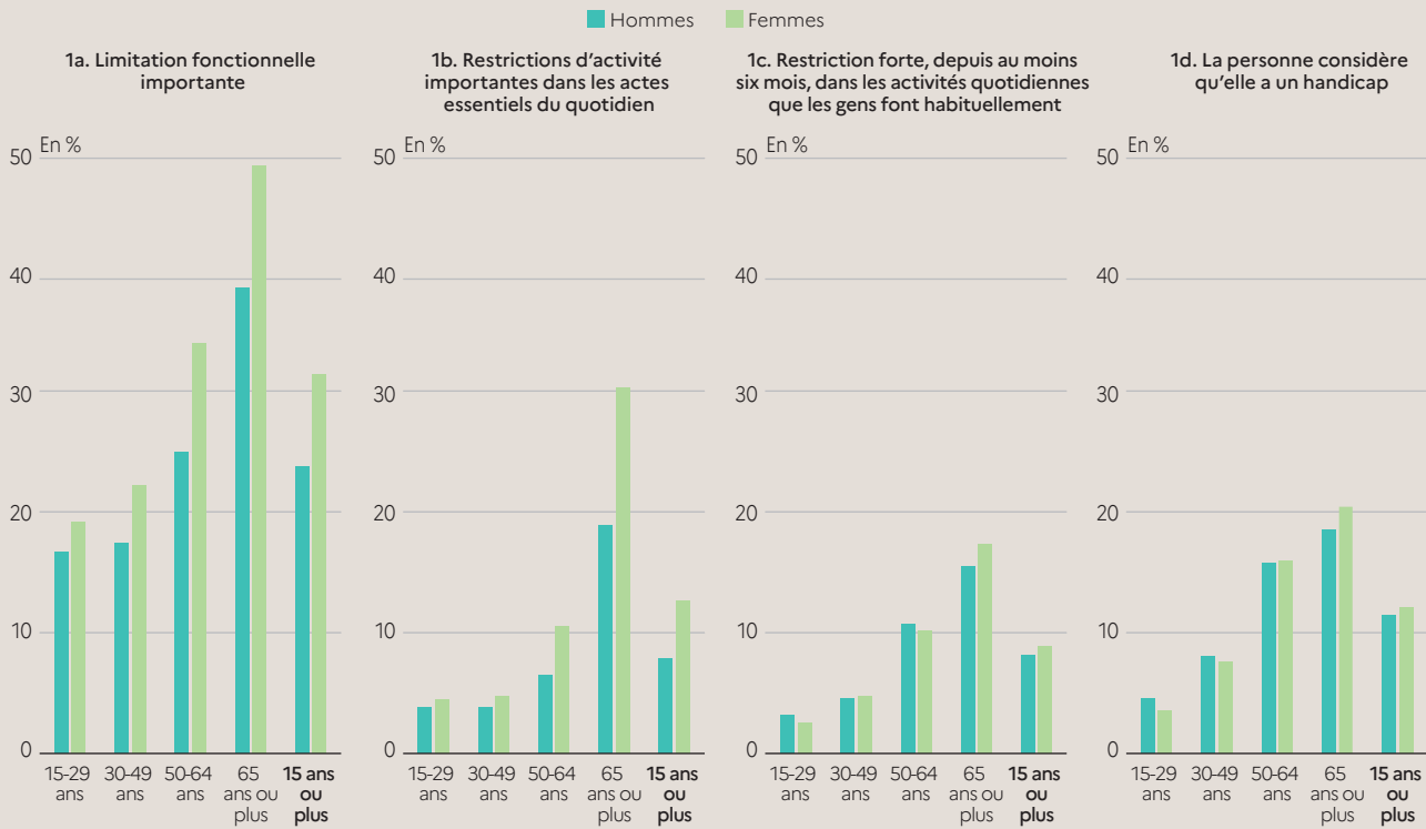
Graphique 1 Approches du handicap selon le sexe et l'âge

Lecture > 48,7 % des femmes de 65 ans ou plus ont au moins une limitation fonctionnelle importante.